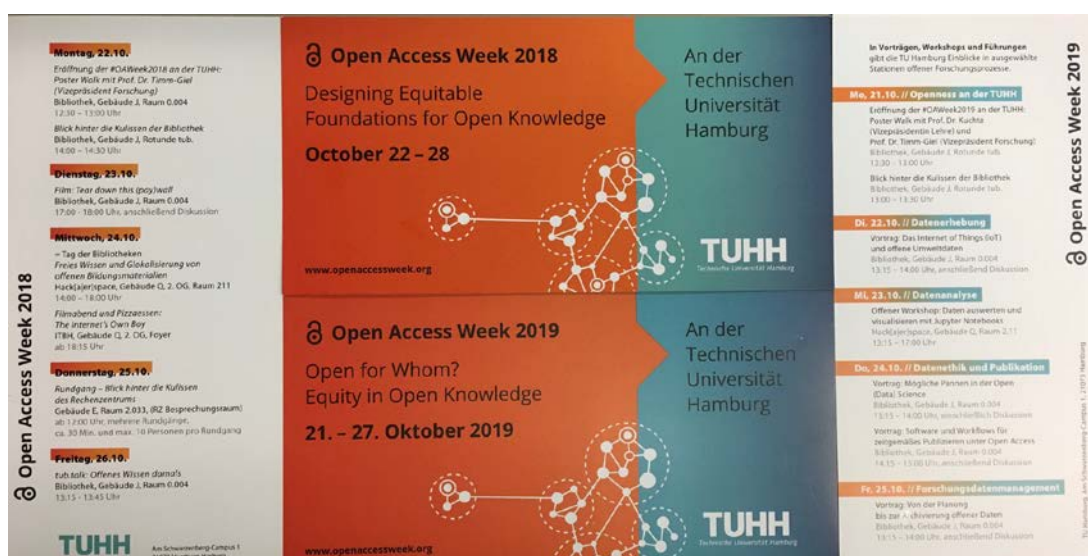
Abbildung 2: Programm-Flyer der Open-Access-Wochen 2018 und 2019 20

Hilfreich war die Zusammenarbeit in der Gruppe etwa für die Planungen der Open Access-Wochen 2018 und 2019, bei denen erstmals mit Unterstützung des an „openTUHH“ beteiligten TU-Institutes „Technische Bildung und Hochschuldidaktik“ von Montag bis Freitag ein tägliches Programm geboten wurde. Besonders im Rahmen der Open Access-Woche 2019 berichteten Wissenschaftliche Mitarbeiter*innen aus TU-Instituten als Best Practice-Beispiele über ihre Arbeit und ihre Motivation, sich für Open Access und Open Science zu engagieren. Die Themen waren hier orientiert an Arbeitsphasen bei der Nutzung von Daten („data literacy“). So standen beim Punkt Datenerhebung die Themen „Das Internet of Things (IoT) und „Offene Umweltdaten“ im Mittelpunkt. Im Rahmen der Datenanalyse ging es um das „Daten auswerten und visualisieren mit Jupyter Notebooks“. Es folgte unter der Überschrift „Datenethik und Publikation“ die Thematisierung möglicher Pannen in der Open (Data) Science sowie das Angebot von „Software und Workflows für zeitgemäßes Publizieren unter Open Access“. Beim Abschluss zum Forschungsdatenmanagement wurde unter dem Titel „Von der Planung bis zur Archivierung offener Daten“ aus dem Projekt Hamburg Open Science an der TUHH berichtet.