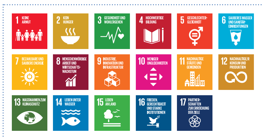
Die 17 Nachhaltigkeitsziele der Agenda 2030