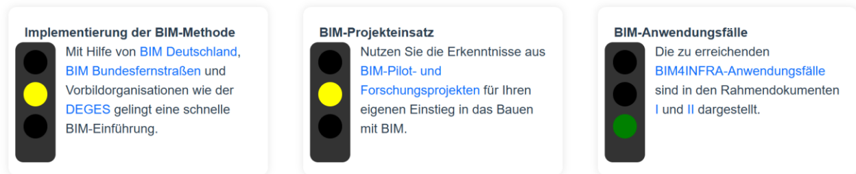
Abbildung 4: Ausschnitt aus der Auswertungsdarstellung im Web-Tool mit Links zu unterstützenden Web-Dokumenten, eigene Darstellung