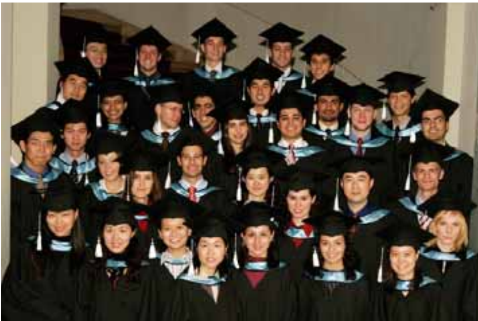
Die Class 04 im Spiegelsaal