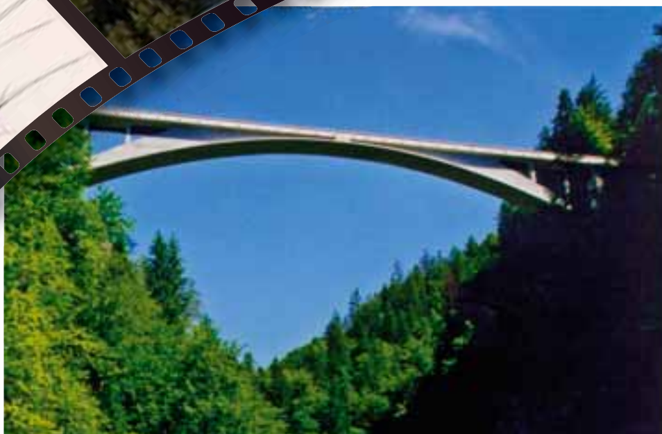
Die Salginatobel-Brücke, Schweiz

Forschungsansatz ist es ihnen gelungen, eines der begehrten DFG-Kollegs zur Forschung sowie der Förderung des wissenschaftlichen Nachwuchses an die TUHH zu holen.